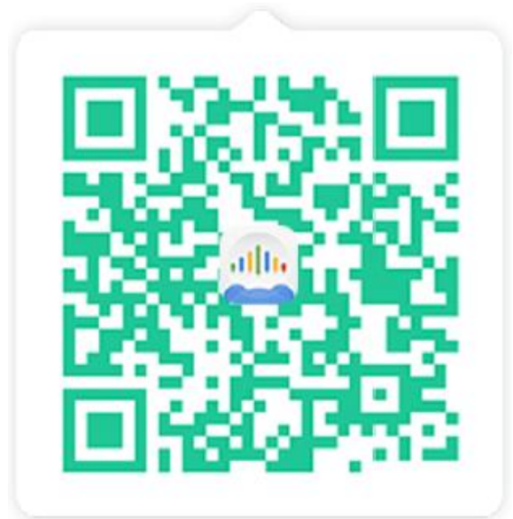
长按二维码图片 点击识别图中二维码即可下载